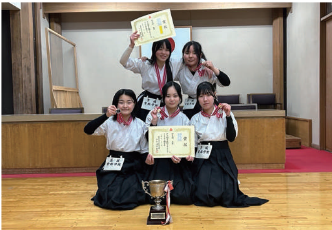
※東日本高等学校弓道大会出場